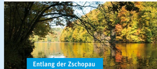
Entlang der Zschopau

Die Haltestelle Frankenberg, Am Rittergut wird in der gesamten Saison 2018 nicht bedient. Nutzen Sie hier die Haltestelle Frankenberg, Humboldtstraße.